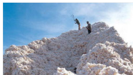
【每日一评】价格干预能否控制粮棉涨价？ 财新记者 龙周园 07月12日 14:20 政府要容忍农产品价格适当浮动；若须调控，增加供给要优于打击投机等行政手段