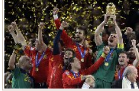
西班牙1:0荷兰首夺世界杯

财新网所刊载内容之知识产权为财新传媒及/或相关权利人专属所有或持有。未经许可，禁止进行转载、摘编、复制及建立镜像等任何使用。 增值电信业务经营许可证：浙B2-20100040 | 浙新办〔2010〕3号 | 浙ICP备09091429号 Copyright 财新网 All Rights Reserved 版权所有 复制必究