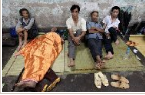
安徽桐城大沙河溃堤 八万受灾群众转移